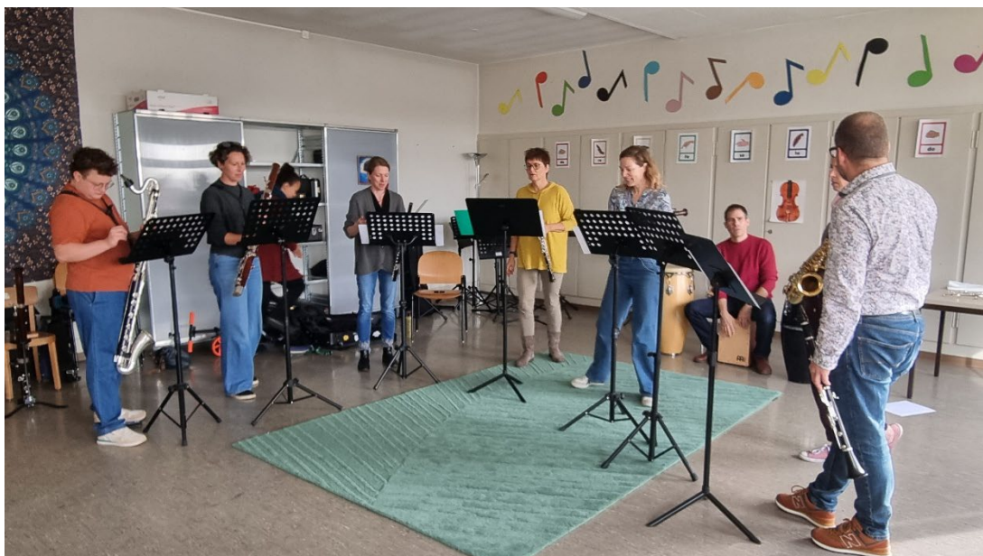
Die Holzbläserfachschaft am Tag der offenen Musikschule in Langenthal

Ministrings/ Beginners 10.12 in der Aula der OML