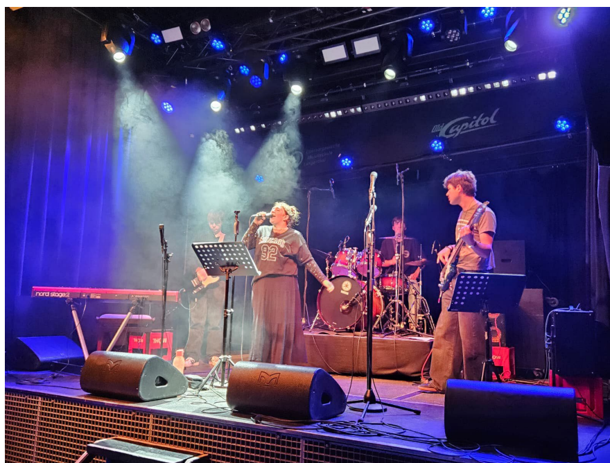
Die OML Band «The Difference» im Old Capitol