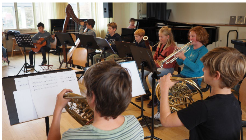
Während der Musikwoche 25